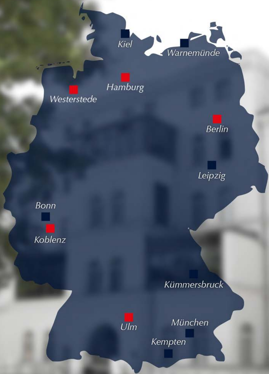
Abbildung: Bundeswehrkrankenhäuser ■ und fachärztliche Untersuchungsstellen ■ mit psychiatrischer Versorgung