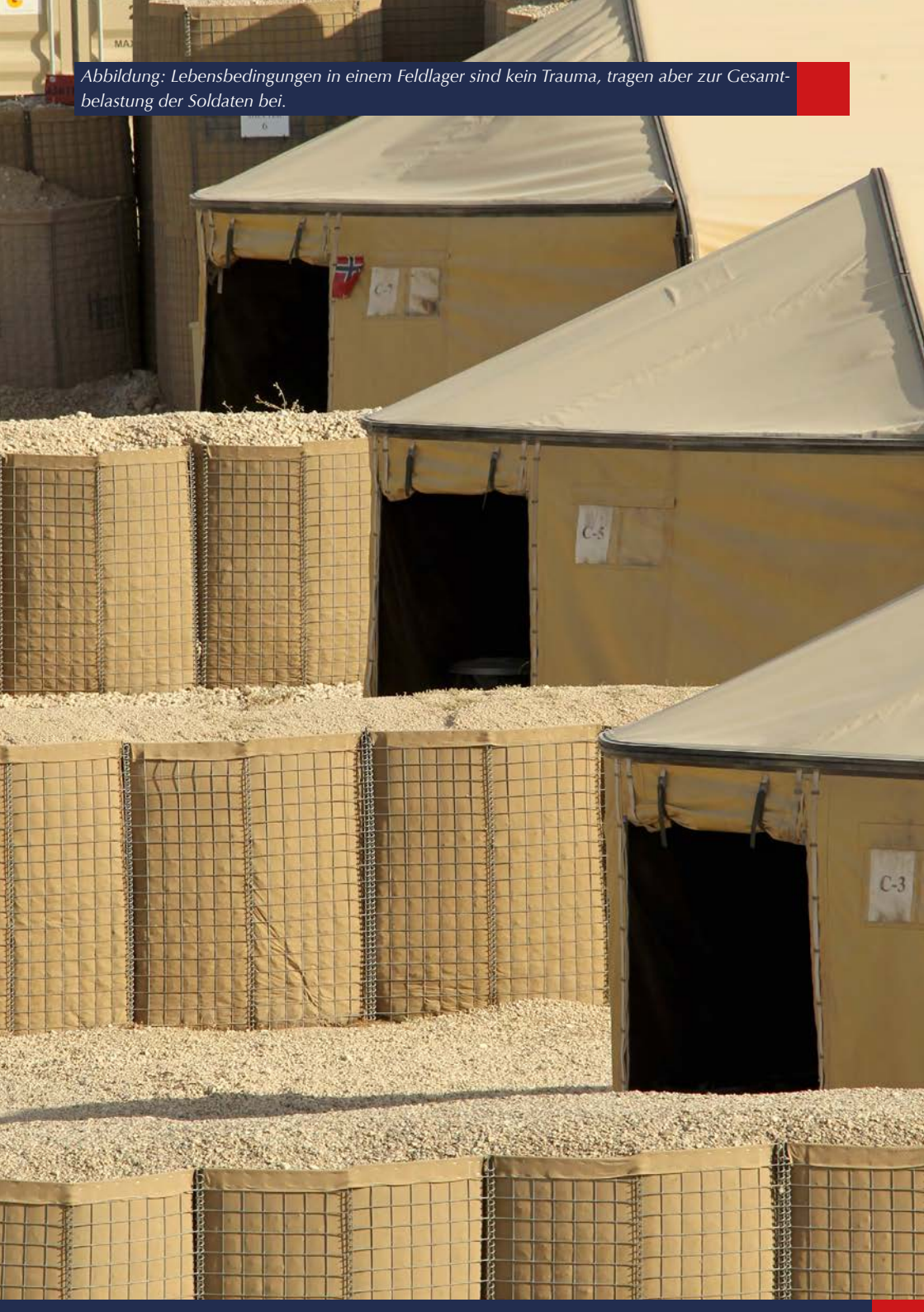
Abbildung: Lebensbedingungen in einem Feldlager sind kein Trauma, tragen aber zur Gesamtbelastung der Soldaten bei.