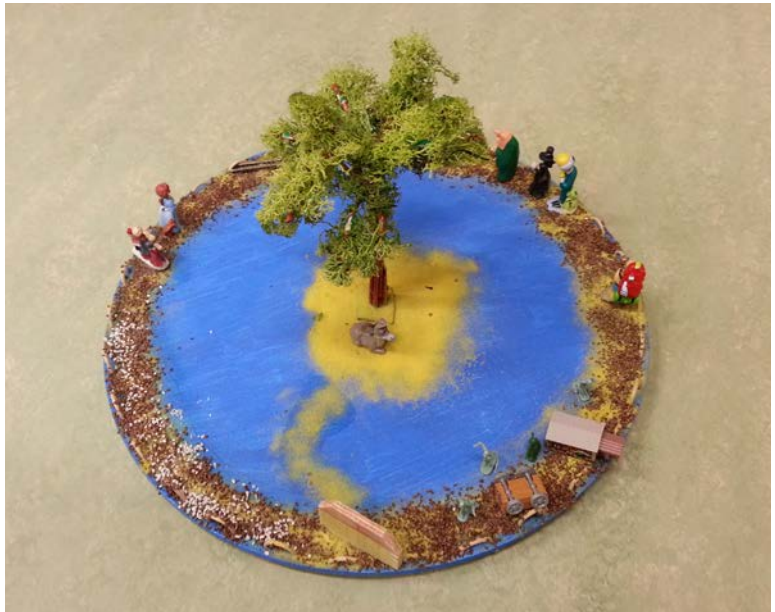
Abbildung: Ergotherapie- Arbeit, bei der das innere Fantasie-Bild eines Ortes der Sicherheit und Ruhe plastisch dargestellt wurde.

Ergänzend zur Psychotherapie wird den Patientinnen bzw. Patienten nicht selten eine medikamentöse Behandlung empfohlen. Der Vorteil kann darin liegen, dass bestimmte Teile der Symptomatik wie Angespanntheit, Rückzug, Antrieb oder Ängste binnen zwei bis drei Wochen deutlich gebessert werden können und die Zugänglichkeit bzw. die Offenheit für Veränderungen in den Gesprächen gesteigert wird. Die heute verfügbaren Medikamente haben nur wenige Nebenwirkungen und verursachen keine Abhängigkeit. Sie helfen zwar nur so lange, wie sie zuverlässig eingenommen werden, können aber bei fortgeschrittener gesprächstherapeutischer Bearbeitung meist wieder abgesetzt werden.