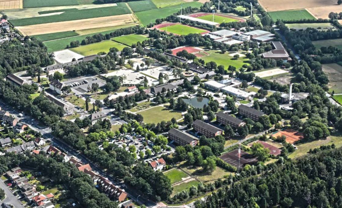
Abbildung: Sportschule der Bundeswehr Warendorf

Versehrte, einen dreiwöchigen Sportlehrgang absolvieren. Im Rahmen dieses Lehrgangs bestehen psychologische Gesprächsmöglichkeiten, und es wird seitens der evangelischen Kirche ein Paarseminar an einem der Wochenenden veranstaltet.