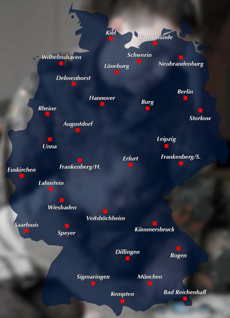
Abbildung: Familienbetreuungscentren/Stand April 2014