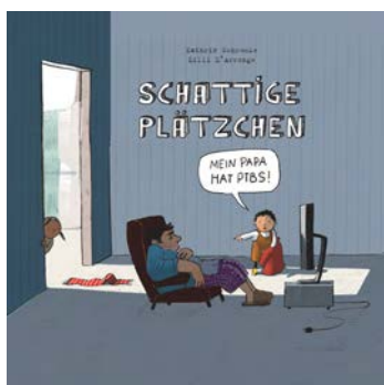
Abbildung: Titelbild des Kinderbuchs „Schattige Plätze“

Entsprechend den oben geschilderten Belastungen für Kinder traumatisierter Eltern ist es im Umgang vor allem wichtig, die Fragen, die das Kind beschäftigt, in einer altersgerechten Form aktiv anzusprechen. Zum Beispiel sollte dem Kind erklärt werden, warum Mutter/Vater in den Einsatz musste, was dort passiert ist (hier sollten allzu gewaltsame Details natürlich eher vermieden werden), aber auch, was Gutes geleistet wurde. Zudem sollte darüber gesprochen werden, welche Veränderungen