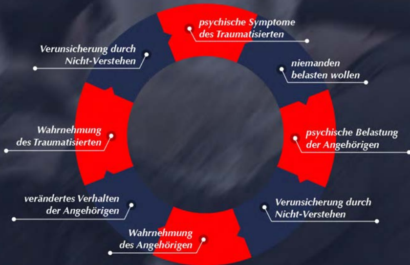
Abbildung: „Teufelskreis“ des Umgangs mit traumatisierten Soldatinnen und Soldaten

Ein Zugang erfordert somit Geduld, es kann Wochen oder Monate nach Einsatzen dauern, bis die Rückkehrer erstmals in der Lage sind, über Belastungen zu berichten. Es kann für sie eine Erleichterung sein, wenn sie gelegentlich interessiert, aber zunächst nur neutral, auf den Einsatz angesprochen werden. Dabei kann es hilfreich sein, wenn sich Angehörige auch anderweitig über das Einsatzland und die dortigen kulturellen Verhältnisse informiert haben. Es fällt ihnen dann leichter, sich in die Erfahrungen der Einsatzsoldatin bzw. des Einsatzsoldaten zumindest in Teilen hineinzusetzen.