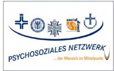
Abbildung: Logo des Psychosozialen Netzwerks der Bundeswehr

besteht darin, dass Betroffene zwischen medizinischen, psychologischen, sozialpädagogischen und geistlichen Berufsgruppen, wählen können, je nachdem, welcher Zugang ihnen am leichtesten fällt. Diese Beratungen werden kostenlos und unverbindlich angeboten und können durch ebenfalls kostenlose und unverbindliche psychiatrische Beratungsgespräche in den Bundeswehrkrankenhäusern und fachärztlichen Untersuchungsstellen bei Bedarf ergänzt werden.