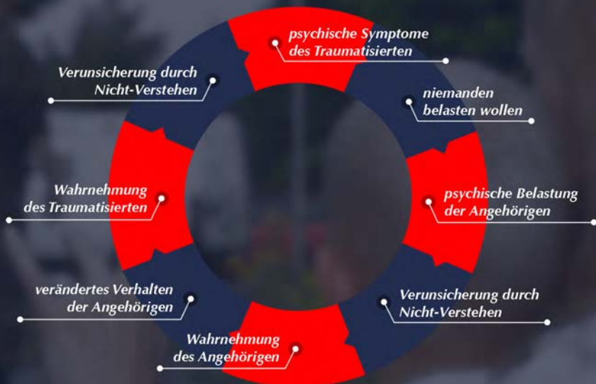
Abbildung: „Teufelskreis“ des Umgangs mit traumatisierten Soldatinnen und Soldaten

Einhergehende Veränderungen im Erleben und Verhalten des Umfelds werden dann wiederum von den psychisch belasteten Soldatinnen und Soldaten wahrgenommen, jedoch ebenfalls nicht verstanden, wenn die zugrunde liegenden Gedanken nicht besprochen werden. Nun entstehen bei den Traumatisierten Verunsicherung sowie Gefühle und Reaktionsweisen, die denen der Angehörigen ähneln (Ängste und Schuldgefühle), und so ist unmerklich ein „Teufelskreis“ in Gang gekommen - genährt durch Sprachlosigkeit (siehe unten stehendes Schema am Beispiel von Angehörigen).