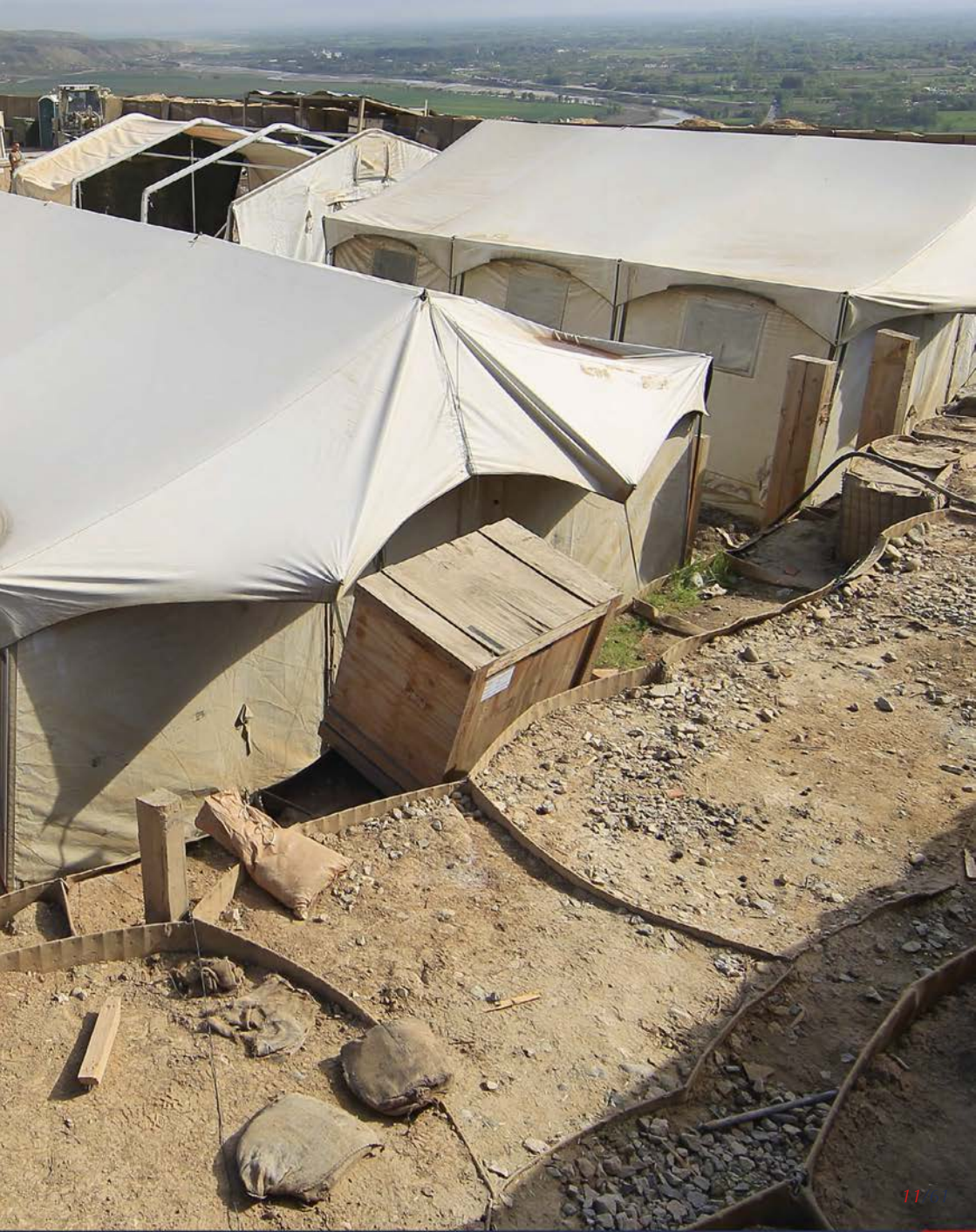
Abbildung: Lebensbedingungen in einem Feldlager sind kein Trauma, tragen aber zur Gesamtbelastung der Soldaten bei.