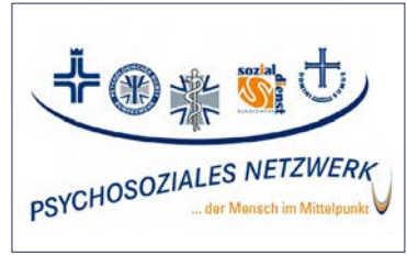
Abbildung: Logo des Psychosozialen Netzwerks der Bundeswehr

Ein zusätzliches Hilfsangebot nach Auslandseinsätzen sind die in den ersten drei Monaten verpflichtend zu besuchenden Einsatznachbereitungsseminare. Hierbei soll ein innerliches Abschließen mit dem Einsatz, aber auch eine Früherkennung psychischer Störungen ermöglicht werden. Als Teil des PAUSE-Programms der Bundeswehr können zur Erholung kostenlose Präventivkuren absolviert werden. Diese Kuren finden für 2-3 Wochen in zivilen Kliniken statt und helfen, etwaige Belastungen und Erkrankungen zu erkennen, erste Stabilisierungs-Techniken zu vermitteln und ggf. zu weiter gehender Therapie zu motivieren. An diesen Präventivkuren können auch Angehörige zu einem Selbstkostenpreis teilnehmen.