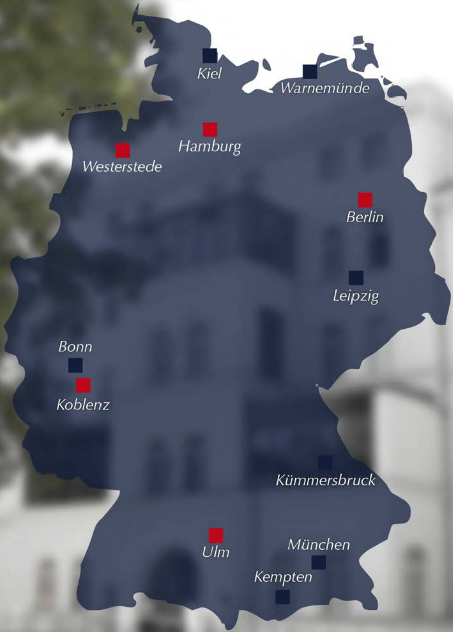
Abbildung: Bundeswehrkrankenhäuser ■ und fachärztliche Untersuchungsstellen ■ mit psychiatrischer Versorgung