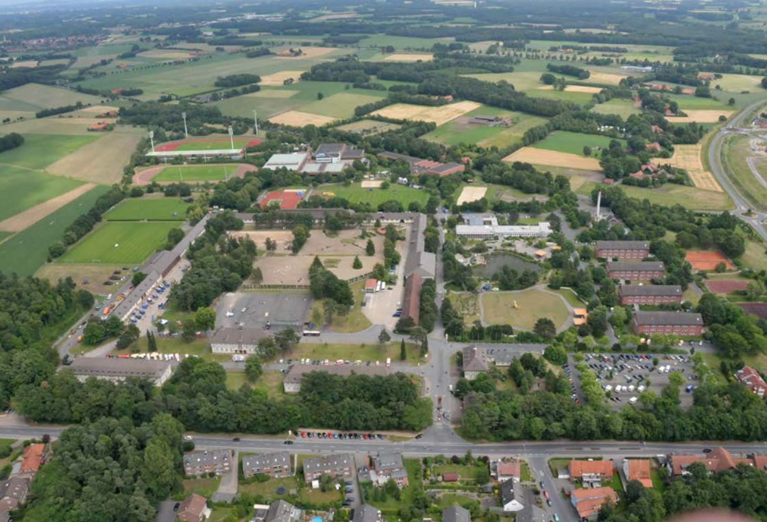
Abbildung: Sportschule der Bundeswehr Warendorf

Partner und Kinder gemeinsam und ggf. können dabei Anregungen zu gemeinsamen Veränderungen entstehen.