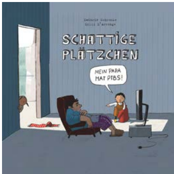
Abbildung: Titelbild des Kinderbuchs „Schattige Plätzchen“

Ihr Kind nimmt etwaige Veränderungen genau wahr, auch wenn es dies oft nicht benennen kann. Sie können für Ihr Kind hilfreich sein und dessen Ängste, Verunsicherung, vielleicht sogar Schuldgefühle deutlich mindern, indem Sie die Fragen, die das Kind beschäftigen, in einer altersgerechten Form aktiv ansprechen. Zum Beispiel sollte dem Kind erklärt werden, warum Mutter/Vater in den Einsatz musste, was dort passiert ist (hier sollten allzu gewaltsame Details natürlich vermieden werden),