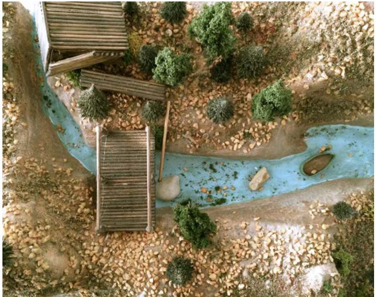
Abbildung: Ergotherapie- Arbeit, bei der das innere Fantasie-Bild eines Ortes der Sicherheit und Ruhe plastisch dargestellt wurde.

Therapeutinnen und Therapeuten unterliegen der ärztlichen Schweigepflicht und dürfen daher nach Strafgesetzbuch niemals ohne Zustimmung ihrer Patientinnen und Patienten mit dritten Personen (also auch nicht mit Angehörigen) über die Inhalte der vertraulichen Arzt-Patient-Gespräche sprechen.